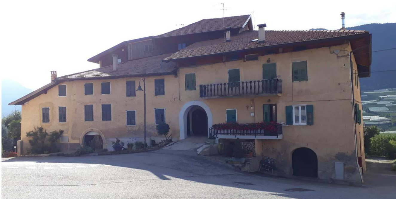
Vista da est